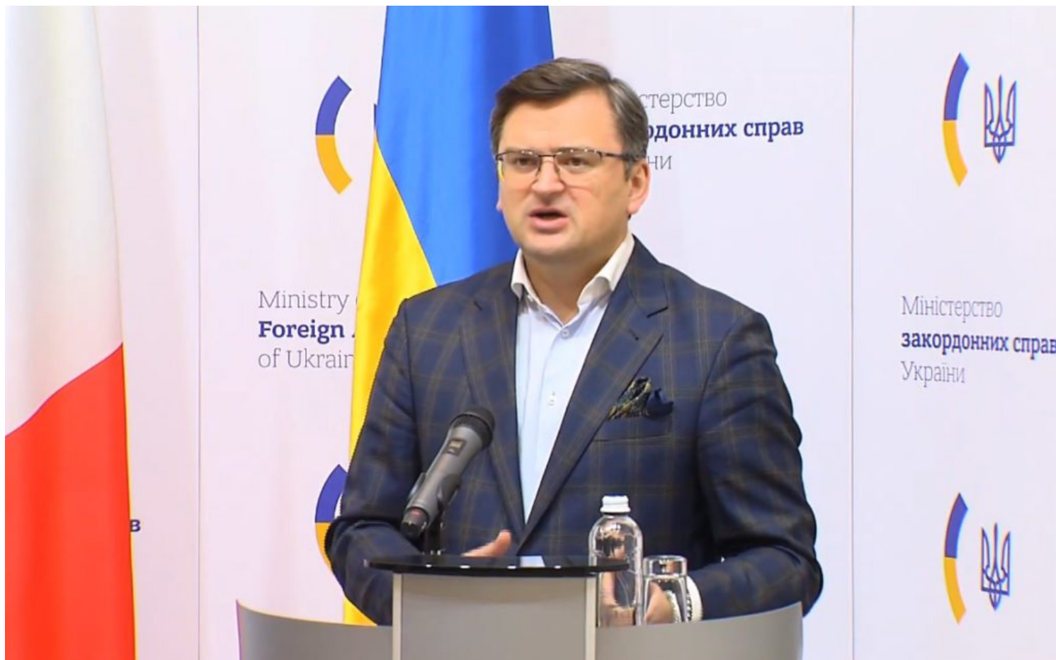
Il ministro Dmytro Kuleba