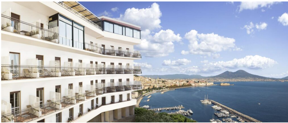
Hotel Paradiso di Napoli