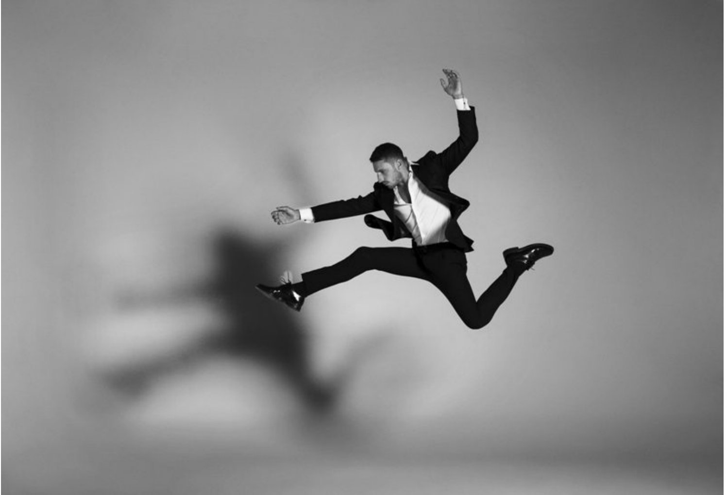
Costantino Imperatore

L'associazione Stefano Francia EnjoyArt organizza a Terni il 30 aprile la quarantesima Giornata Mondiale della Danza un convegno e la premiazione del concorso multi arte "DILLO ALLA DANZA" con il patrocinio del CID UNESCO e del Comune di Terni