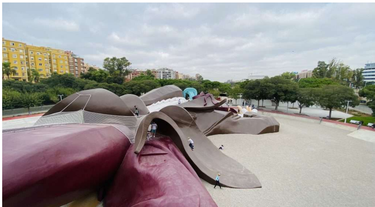
Il gigante Gulliver

I più piccini saranno felici, il popolare parco di Gulliver dei giardini del Turia riapre completamente restaurato. Si potrà di nuovo scivolare nella giacca del gigante Gulliver, arrampicarsi tra la barba o correre tra le sue gambe. Nello spazio interno del gigante è stata creata una nuova zona giochi per i più piccoli, che ancora non possono salire sul Gulliver.